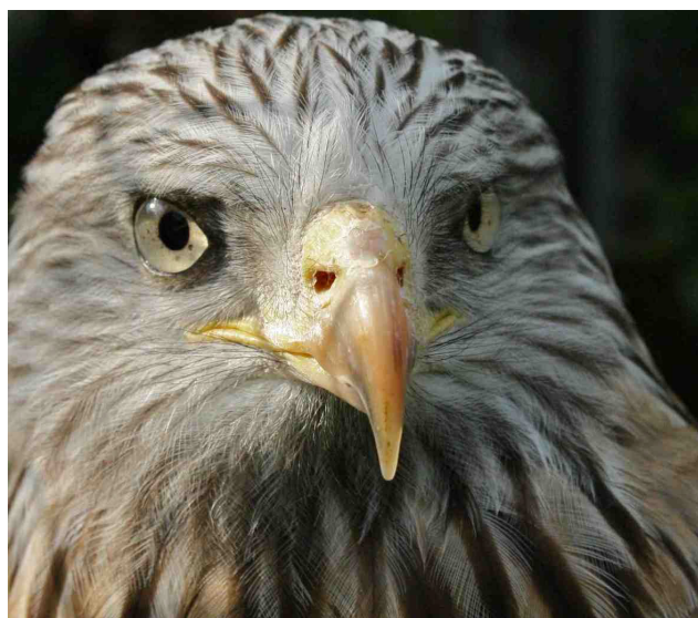
Le milan royal