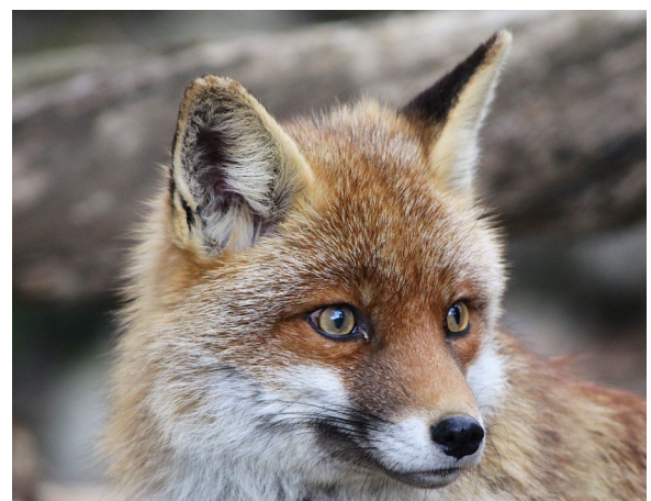
Le Renard roux

Quel vrai défi de déterminer qui a mangé les noisettes de nos jardins !